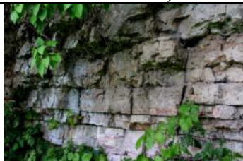
Dolesmuižas atsegums