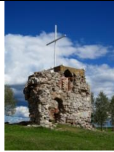
Sv. Jura luterāņu baznīcas drupas