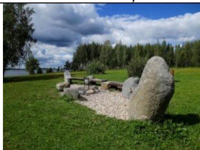
Ugunsкура vieta – atpūtas vieta pie lībieša Ako pieminēkļa