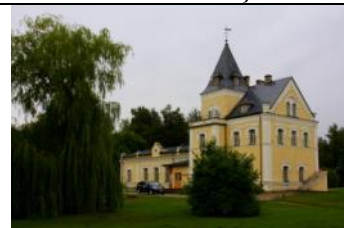
Doles muiža (Daugavas muzejs)