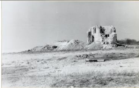
Sv. Jura luterāņu baznīcas drupas. Foto: Raimonds Zalčmanis (1979.), LNB krājums.