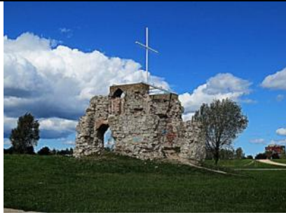
Sv. Jura luterāņu baznīcas drupas