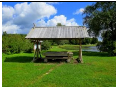
Atpūtas vieta „Jaunkalnes”