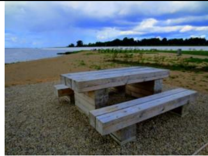
Salaspils pludmale