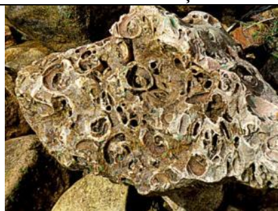
Glieņdzolomīts Daugavas krastā