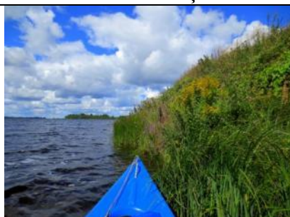
Daugava pie Saulkalnes