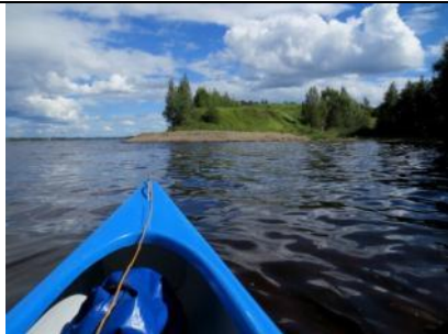
Daugmales pilskalns