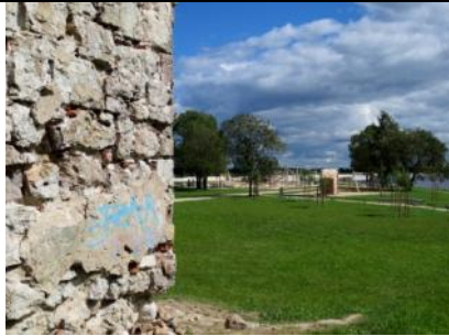
Salaspils pludmale