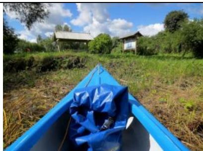
Atpūtas vieta „Jaunkalnes”