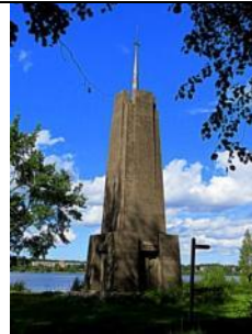
Nāves salas piemineklis