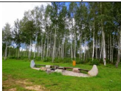
Ugunsкура vieta – atpūtas vieta pie Ako pieminēkļa