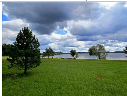
Atpūtas vieta pie lībieša Ako pieminēkļa